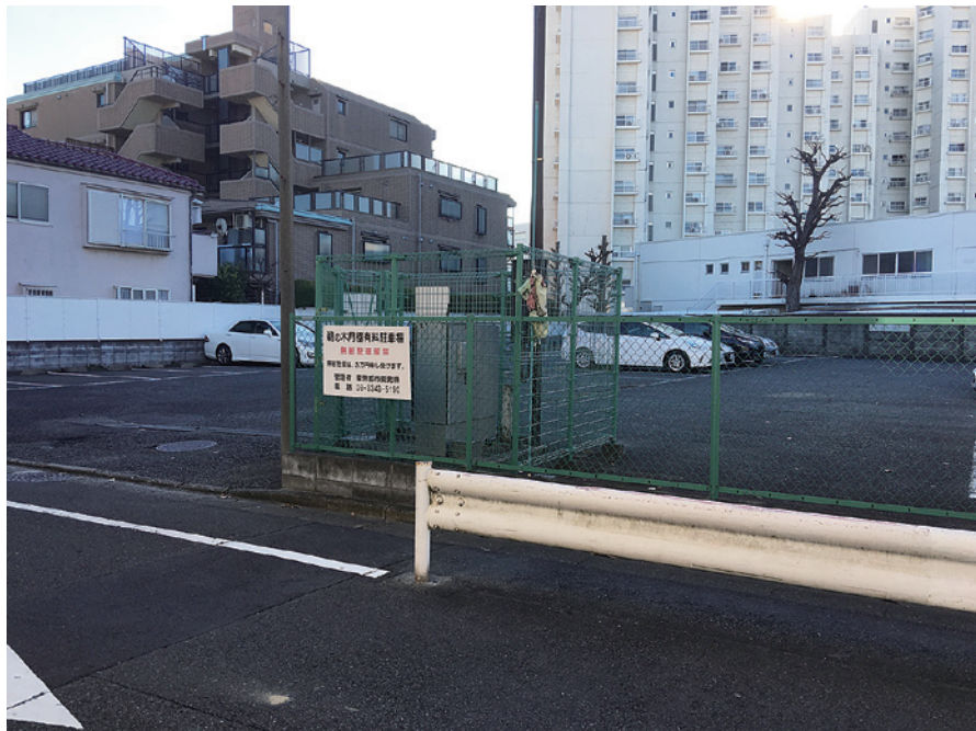
鵜の木3丁目の都水道局所管都有地（現在は駐車場）

これまで共産党区議団は“公有地に保育園や特養ホーム建設を”と繰り返し議会で求めてきました。これからも区民の皆さんの声に寄り添い、暮らしと福祉が大切にされる区政実現に全力を尽くします。