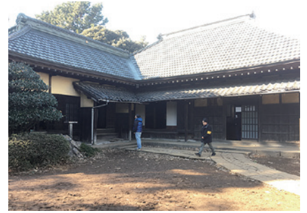
古民家見学会（鵜の木1丁目）