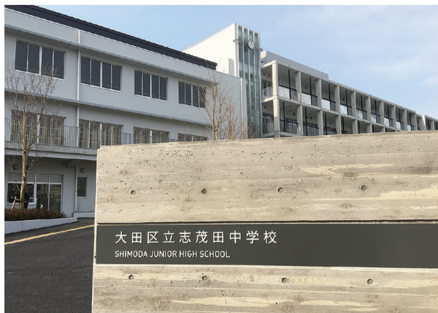
福祉施設との複合化が進められている志茂田中学校

「複合化ありき」で事を進めるのではなく、地域の要望や意見を踏まえて検討するべきです。