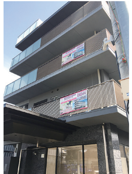
特別養護老人ホーム 「さくらのみち紫苑」