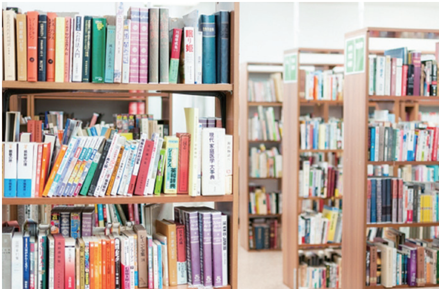
イメージ

区内での特養ホーム待機者は現在1255人と、依然として深刻な状況です。老後の安心のため、積極的に公有地を活用し予算を拡充させ、待機者解消の取り組みを強化すべきです。